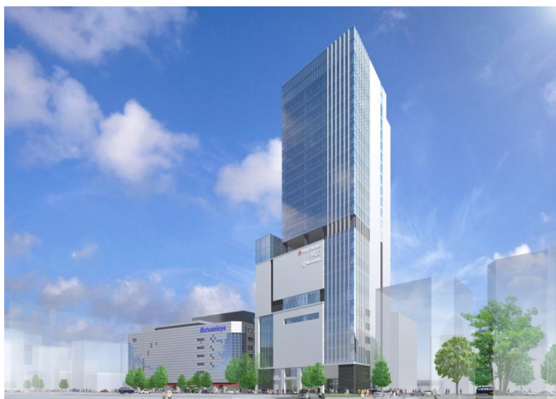
▲完成予想CG（現時点でのイメージであり、今後変更の可能性があります）

三菱地所グループでは、丸ビル、新丸ビルや横浜ランドマークタワーをはじめとした大型複合ビル、百貨店を含む複合商業施設「有楽町イトシア」など数多くの開発事業を手掛けてまいりました。本プロジェクトにおいても、これらの事業で培ったグループの総力を挙げて強力でサポートしてまいります。