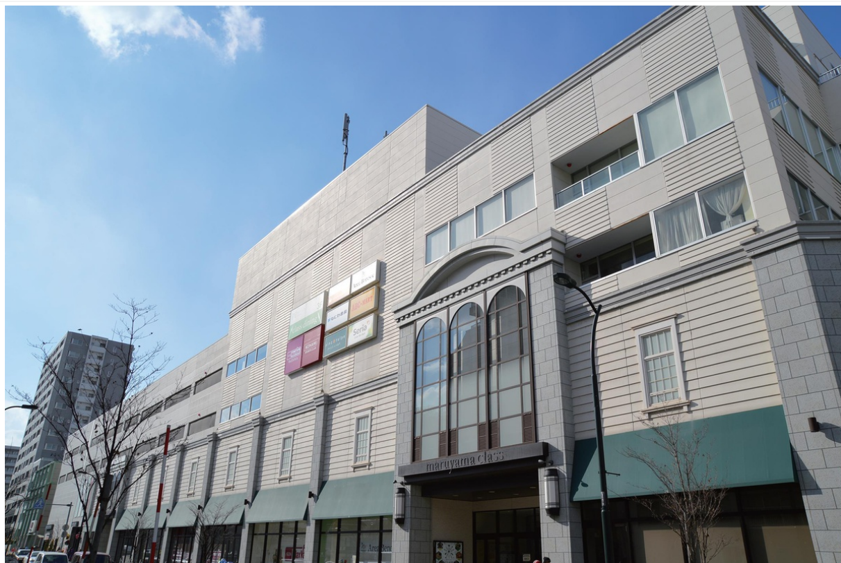
10周年を迎えた maruyama class

開業10周年を迎え、今後もゆとりに満ちたライフスタイルの発信を続け、お客さまが憩う・癒す・楽しむ「円山らしい暮らし」をサポートする商業施設を目指します。