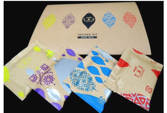
ブリリアントミルク、サニーミルク、ビビッドミルク、ベルベットミルクの4種類をテイastingできるキット。