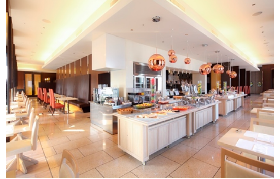
レストラン「ハーモニー」内観

チョコレートを食べ比べてお気に入りのチョコレートをひとつ選び、ハッシュタグをつけてSNSにアップした画面をレストランスタッフに提示すると、その場で明治ザ・チョコレートをお一人様1箱プレゼントいたします。