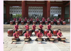
福島県立塙工業高校 和太鼓部

現在部員総数29名、年間約70回の公演に出演。『子どもがふみだす Fukushima復興体験応援事業』では清水寺や、大阪城、鶴岡八幡宮など全国各地の寺社仏閣で演奏を実施。昨年、一昨年と全国高等学校総合文化祭に出場し、来年も出場が決まっている。