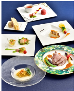
ムーンライトクルーズコース （5,940 円・サ別） サンシャイン クルーズ・クルーズ

内容：SKY CIRCUS サンシャイン 60 展望台の入場チケット（1,200 円相当）付きの、月をモチーフにした色鮮やかな見た目にも美味しい特別メニューを提供します。※Moonlight メニューは OZmall ( http://www.ozmall.co.jp/ ) でのご予約も承ります。