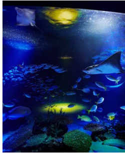
サンシャインラグーン～満月 ver.～