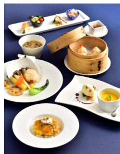
中秋満月 ～moon watching party～ （5,980 円） ジョーズシャンハイ