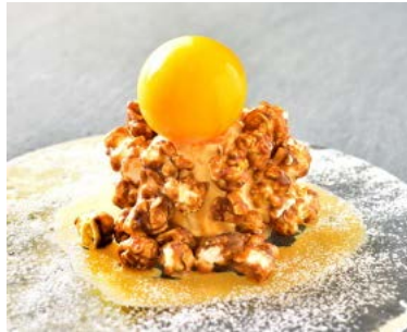
限定オリジナルお月見スイーツ