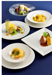
MAHINA (マヒナ) コース （7,128 円） ジンジャーズビーチ サンシャイン