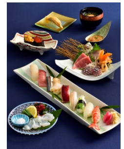
カウンター限定 moon light コース （6,480 円）※要予約 鯨処 銀座 福助