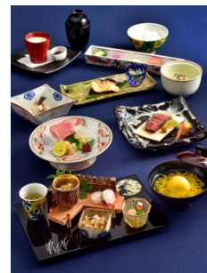
天空の湖月コース （7,560 円・サ別） 天空の庭 星のなる木