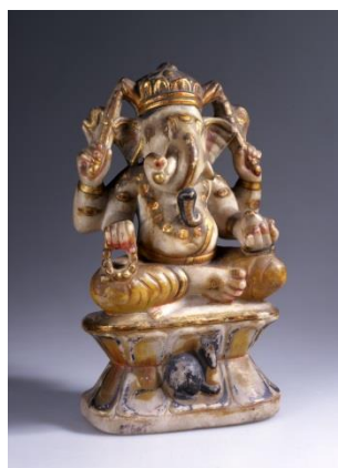
ガネーシャ神像 (インド・18世紀) 天理大学附属天理参考館蔵