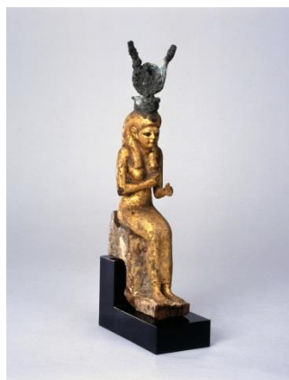
イシス女神像 (エジプト・前1千年紀) 天理大学附属天理参考館蔵