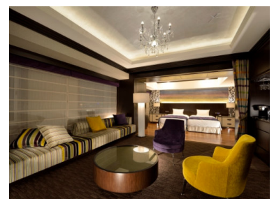
スイートの一例。お部屋ごとに異なるデザインをお楽しみください。