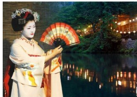
舞妓さんがお席にお邪魔した際に、ご自身のカメラでスナップ写真をお撮りいただけます。