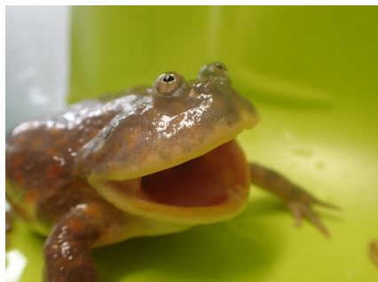
マルメタピオカガエル

マダガスカル東部に生息する固有種で赤い体色が特徴的。身の危険を感じると腹部を膨らませ威嚇する。