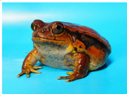
サビトマトガエル