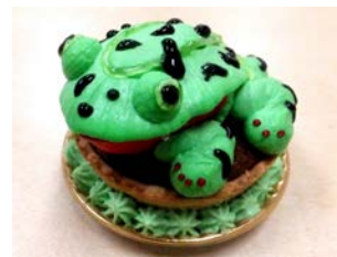
サンシャイン水族館オリジナル チョウセンスズガエルケーキ ホワイトチョコガナッシュとメロンクリームを使用