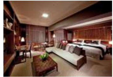
プレミアムフロアの一例 ロイヤルパークホテル ザ 京都 スイート (Tsuzura)

レストランで朝食ブッフェをお召し上がりいただける他、様々な特典をご用意しています。