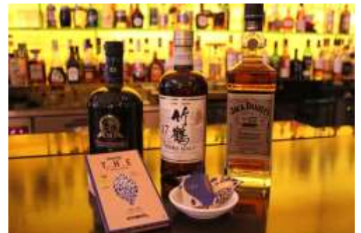
ロイヤルパークホテル ザ 汐留 「THE BAR」イメージ

●期間中、THE チョコレートテイasting映像を「ロイヤルパークホテル ザ 汐留」のロビーで放映予定です。新しいチョコレートの楽しみ方をご提案します。