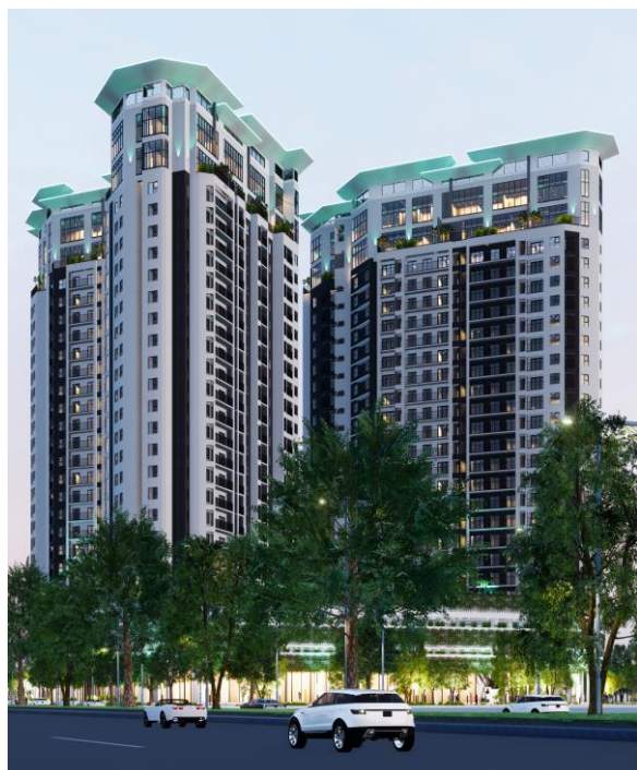
(X字の特徴的な外観)