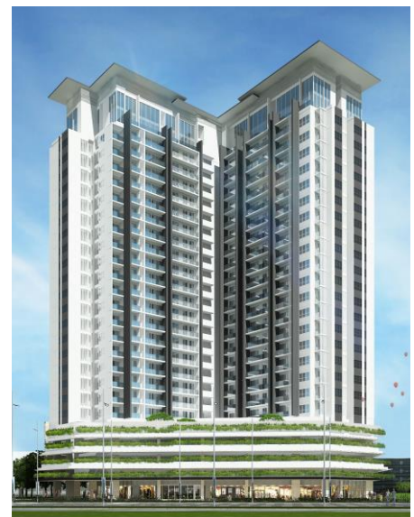
物件完成予想図(建物外観)

また、三菱地所グループはこれまでにベトナム・ホーチミン市にて計約2,000戸の住宅を分譲し、ハノイでは約1,300戸の住宅開発を行っています。ベトナムにおけるプロジェクトは初参画となる三菱地所レジデンスは、現地デベロッパーとの合弁会社を立ち上げているタイをはじめ、マレーシア、インドネシア、オーストラリアでの住宅開発事業に参画しており、現在までに参画した案件は24物件(総戸数19,000戸超)となっています。