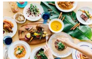
▲飲食メニュー イメージ