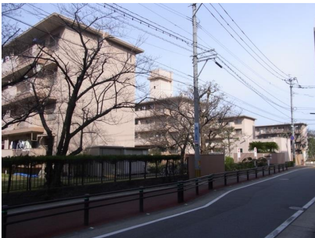
▲「藤崎公団住宅」現況写真

藤崎公団住宅（1969年全体竣工）は、福岡市営地下鉄空港線「藤崎」駅から徒歩2分に位置する、日本住宅公団（現:UR 都市機構）が分譲した全4棟・地上4階建・総戸数112戸の集合住宅（団地）です。本建替えは、築年数の経過による設備の老朽化、エレベーター未設置等バリアフリーへの未対応、住戸面積の狭さ問題などから、2007年から検討されてきました。2015年より管理組合にて株式会社ラプロスを建替えアドバイザーに迎えて本格的な検討を行い、同年5月に建替え推進決議を可決。2016年6月に三菱地所レジデンス・福岡地所・積水ハウスが事業協力者として選定され、同年12月に建替え決議が成立しました。今後は区分所有者がマンション建替組合の組合員となり、2017年12月頃に権利変換計画の認可取得、2018年4月の着工を予定し、2020年5月の竣工を目指します。建替え後は地上12階建・総戸数231戸のマンションへと生まれ変わります。