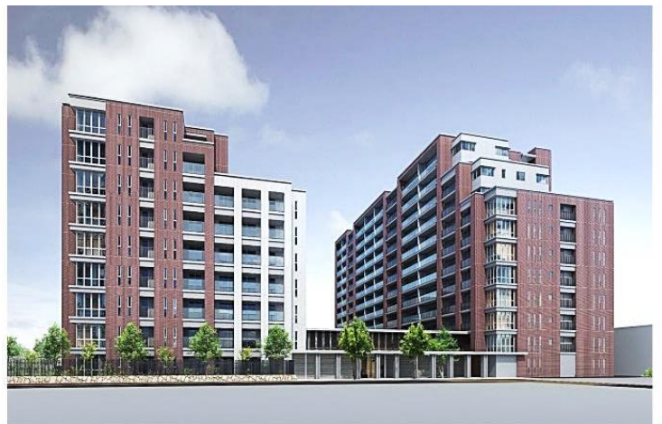
▲建替え後完成予想CG

これまでに全国で15件のマンション建替え実績のある三菱地所レジデンス、福岡都市圏での豊富なマンション開発実績を持つ福岡地所、積水ハウスが事業協力者となり、これまで九州・沖縄において5件のマンション建替え実績のあるラプロスが建替えアドバイザーとなることで、ノウハウを活かして組合員や地域の皆様にご満足いただけるよう事業を推進しています。