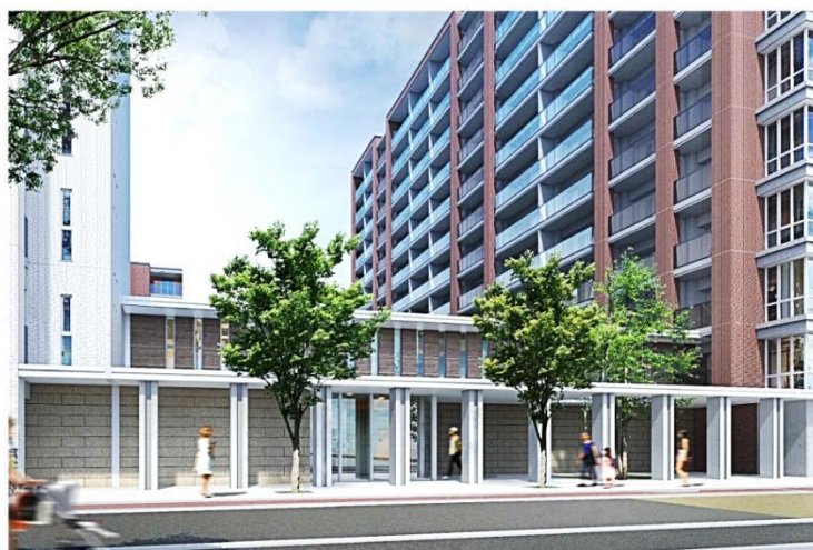
▲ 建替え後完成予想 CG