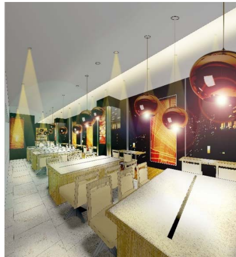
[ディナーイメージ]