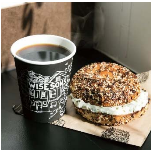
WISE SONS TOKYO (丸ビル 地下1階)

今後とも来街者や就業者の皆様をさらにもてなせる街を目指し、深化を続ける丸の内にご期待ください。