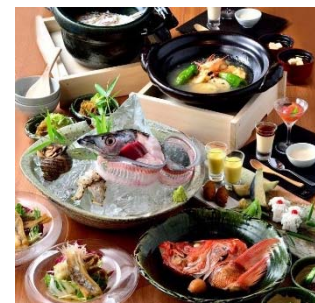
紀州山海料理 愚庵 丸の内店 (丸ビル 6階)