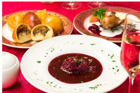
ゴドノフ東京 丸ビル店 (丸ビル 5階)