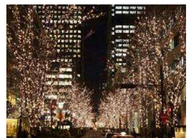
過去開催時の様子

※上記以外にも新丸ビル、丸の内ブリックスクエア、新東京ビル、丸の内オアゾなどのクリスマス装飾もご取材頂けます。