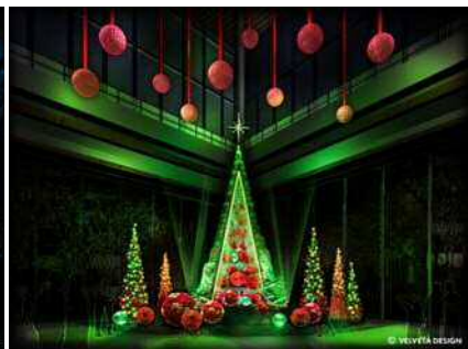
丸ビル「Blooming Anniversary Tree」イメージ(ライティングショー実施時)