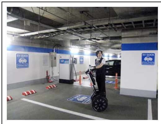
今回導入したセグウェイ

三菱地所は、ランドマーク駐車場に県内最大の電気自動車充電設備を設置、運用しているなど、ランドマークタワーを中心に、みなとみらい地区において環境に配慮した安心安全で地域と共生したまちづくりを目指しています。