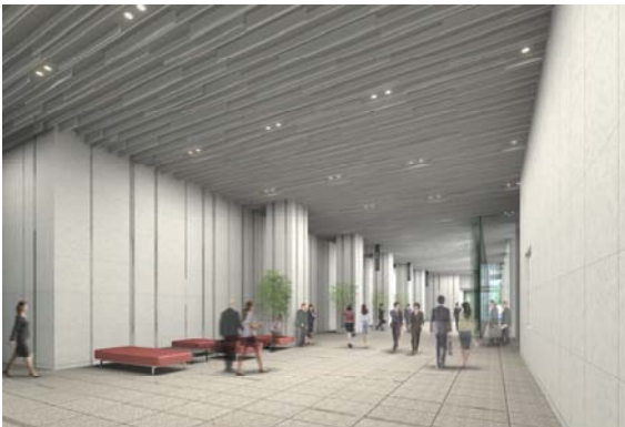
1階／オフィスエントランスホール