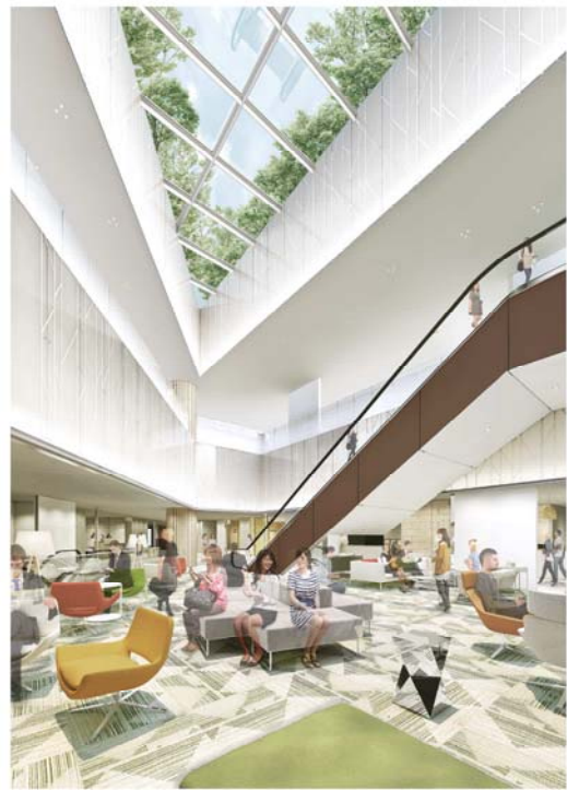
3階／レストスペース